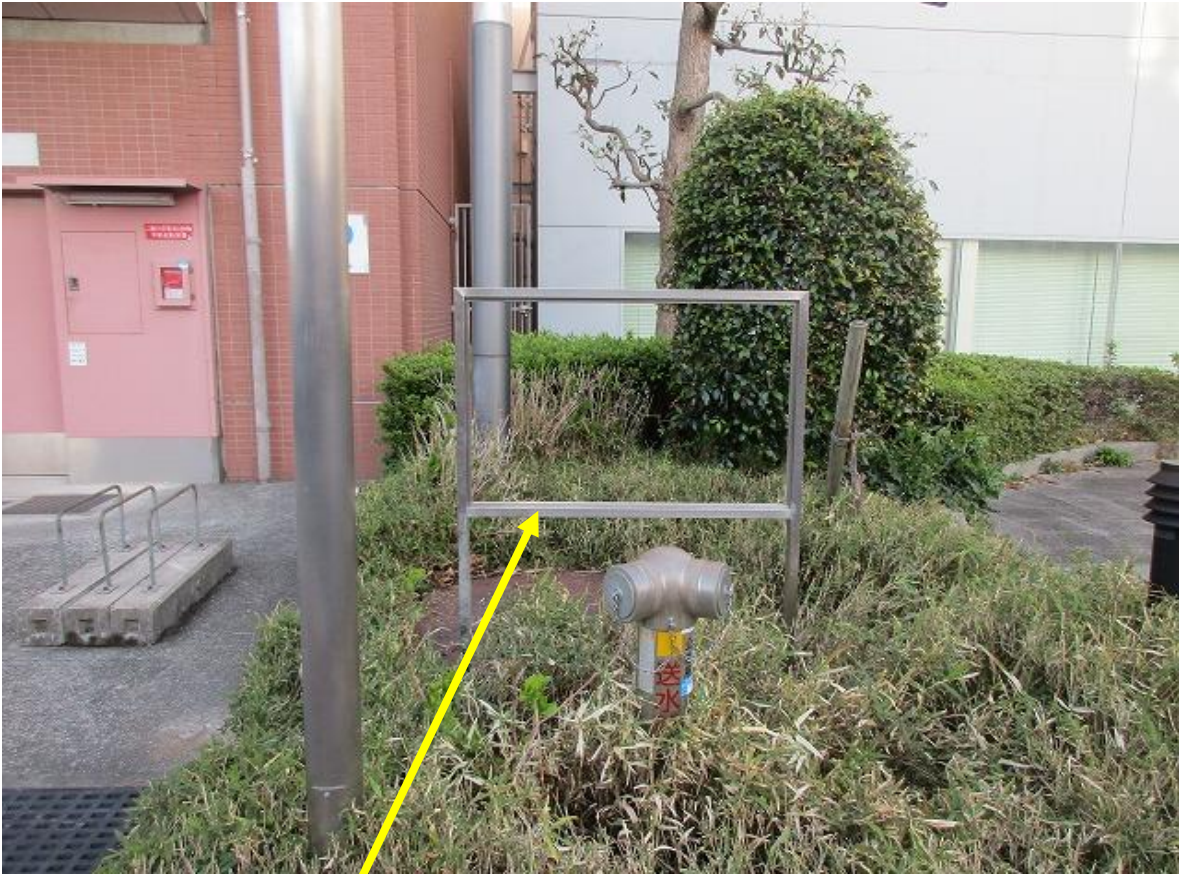
看板枠 ステンレス角材（□-50×25 厚み1.5mm） 全体の大きさ 縦1500 横900 上部看板面 H600 × W900